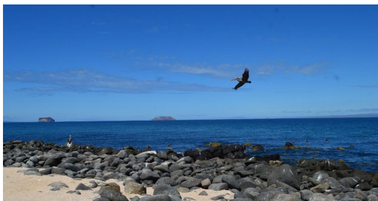
ILHA SEYMOUR NORTE - a vida selvagem impressiona com fragatas, leões-marinhos e paisagens áridas únicas.