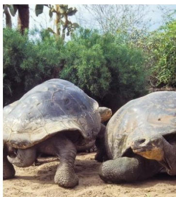
ESTAÇÃO CHARLES DARWIN - preserva a biodiversidade local.