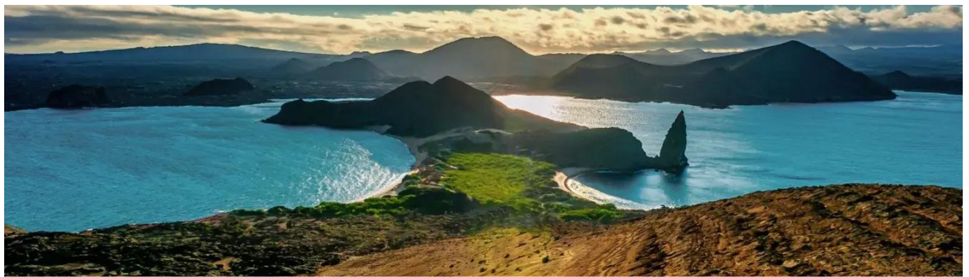
ILHA BARTOLOMÉ - Paisagem icônica, com formações vulcânicas únicas e vistas espetaculares do arquipélago.