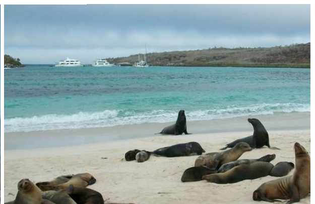
ILHA LOBOS - A natureza se revela em sua forma mais pura, entre leões-marinhos e paisagens intocadas.